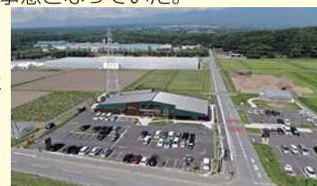
▲地域と官民が連携して開園した 野菜テーマパーク

そこで、富士見町では「農業の成長産業化」を方針として掲げ、「カゴメ（株）」、富士見町、大平地区の三者で、農業・工業・観光が一体となった「野菜のテーマパーク」を整備し、平成31年4月「カゴメ野菜生活ファーム富士見」をオープンした。農業・工業・観光を担う事業者の相互連携により、6次産業化や地域ブランド化が進み、現在はこのテーマパークに年間3万人が来場する人気スポットに成長した。