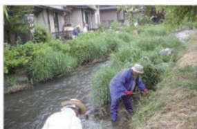
水路の草刈りの様子（長野市）

用水がきちんと行きわたるように調整したり、大雨のときに水路から水があふれないように水門を操作したりすることが、わたしたちの大切な仕事です。また、水路の草刈り、どろ上げなどの日常的な管理や、施設がこわれたときの修理も行います。施設がこわれると大きな事故にもつながるので、古くなった施設の点検や修理をこまめに行っています。