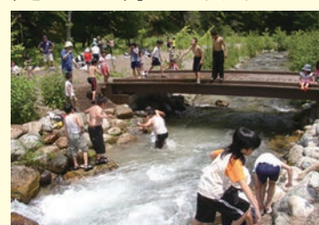
▲越荒沢堰の親水広場 地域住民の憩いの場となっている

多面的機能支払交付金活動では、当土地改良区の区域内の活動組織が行う資源向上支払（施設の長寿命化）について、工事発注や現場管理等を受託し事務支援を行うことで、基幹的水利施設を管理する土地改良区と末端水路を管理する活動組織との連携がより強固になり、上流と下流の一貫した水路管理が行われている。