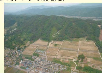
▲基盤整備により再生されたワイン用ブドウ園

本地区で生産されるワイン用ブドウは品質が高く、大手酒造メーカーのプレミアムワインの原料に採用され、国内外のワインコンクールで複数の受賞を果たした。地区内の2つの担い手法人は、それぞれメルシャン、サッポロと提携して契約栽培を行い安定的な収益を確保している。