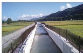
修理された水路の様子（次町市）