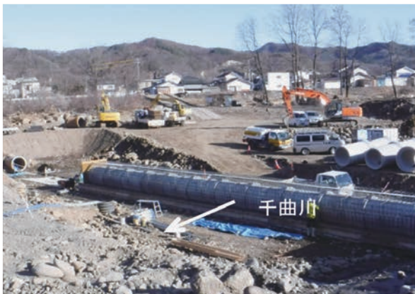
千曲川を横断するサイホンの復旧（佐久市）