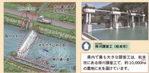
水せき止める部分

用水路のいちばん上流で、河川から水を取るための施設。水田に水を届ける用水路の多くは、河川につくられた頭首工から水を取り、水田まで導いています。